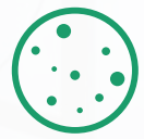
Détection des particules